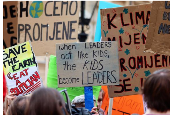
Una huelga de jóvenes ambientalistas sin fecha

El proceso de cambio de políticas es desordenado y complicado, con muchas piezas movibles. El análisis de las políticas realizado para este proyecto necesariamente divide un proceso complejo en fragmentos más pequeños que, como resultado, pueden parecerse un poco a los pasos de un proceso lineal. Lo que no es el caso. La convergencia de diferentes estrategias, actores y procesos en torno a un objetivo compartido, con el cual los diversos actores podían identificarse, fue a menudo lo que proporcionó el impulso para el cambio de políticas. Diferentes individuos e instituciones jugaron un papel importante para lograr que esto sucediera. Invirtieron en las relaciones, interacciones y retroalimentación entre los diferentes procesos y las personas involucradas en el cambio de políticas. Por ejemplo, en el debate sobre una nueva Ley de la Infancia en Sudáfrica, el Instituto de la Infancia coordinó las redes de la sociedad civil y sus miembros para compartir evidencias y las vinculó y respaldó para que aportaran sus contribuciones a los procesos legales y parlamentarios.