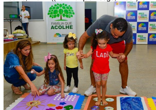
Niños que juegan con sus padres, Familia que Acolhe, Brazil ((Familia que Acoge, Brasil)